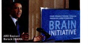
ABD Başkanı Barack OBAMA

Dünyada ve ülkemizde beyin alanında çalışmalar yürüten akademisyenlerin konuşmacı olarak katılacağı 2. G20 Beyin Haritalama Sempozyumu'nda ABD, Türkiye ve diğer G20 ülkeleri arasında beyin haritalama ve tedavilerinin tüm alanlarını içerecek şekilde sağlam bir çalışma işbirliği kurulması amaçlanıyor.