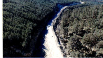
Doğa tahribatı havadan fotograflandı.