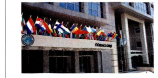
2. G20 Beyin Haritalaması ve Tedavileri Bilimsel Zirvesi'nin ilk ayağı, 13 Kasım 2015 tarihinde Dünya Beyin Haritalama Tedavileri Derneği (SBMT) 'http://www.worldbrainmapping.org/' ile İstanbul'da Üsküdar Üniversitesi Altınuzda Merkez Yerleşkesi'nde düzenlenecek sempozyum ile gerçekleştirilecek.

Beynin sınırlarının araştırılması ve Otizm, Şizofreni, Parkinson, MS, Alzheimer, Depresyon gibi önemli hastalıkların tedavilerinin geliştirilmesi için ABD Başkanı Barack Obama'nın 2013 yılında başlattığı Brain Initiative (Beyin Girişimi) Projesi'nde Türkiye'yi temsil eden Üsküdar Üniversitesi, uluslararası bir zirve düzenliyor.